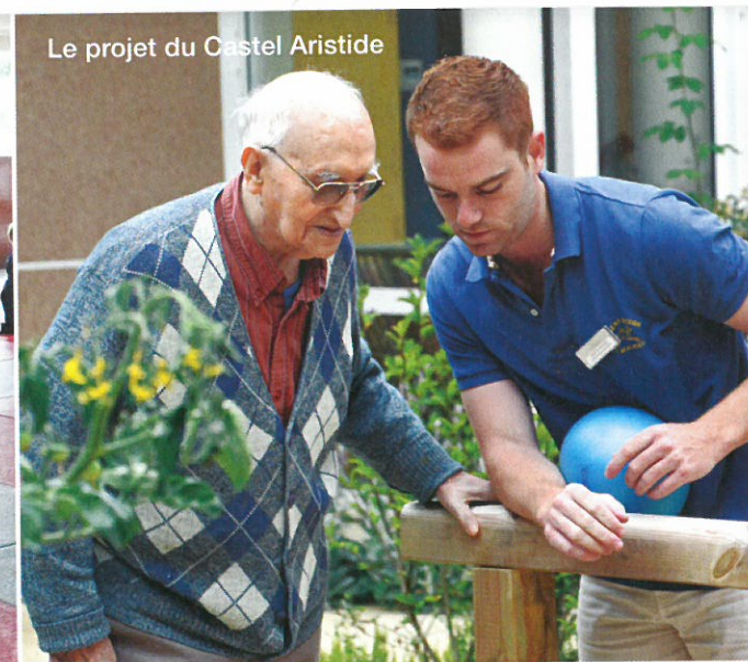
Le projet du Castel Aristide