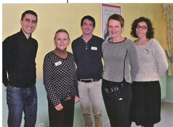
Équipe soignante Ehpad Les Jardins Castel.

Respecter le rythme, les capacités et les envies de chaque résident. Au sein de l'Ehpad Les Jardins du Castel à Châteaugiron (Ille-et-Vilaine), l'équipe pluridisciplinaire met en pratique une approche personnalisée des toilettes. Regards croisés des professionnels de l'établissement.